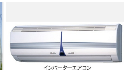
インバーターエアコン