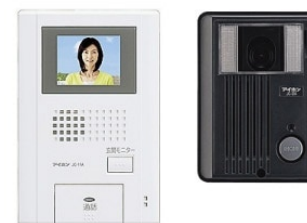
TVインターホン(西日本)